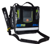
AED Pro® with Softbag AED Pro