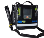
AED Pro® mit Softbag AED Pro